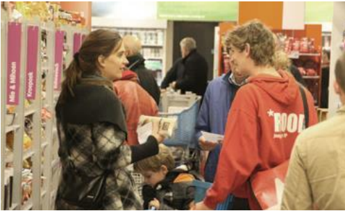
ROOD in gesprek met supermarkt bezoekers over de Mosquito

flyers bij de ingang van het gemeentehuis om iedereen die daar langs kwam lopen te laten zien dat de woningnood onder jongeren enorm is toegenomen. Ze informeerden de mensen dat er in Zutphen genoeg leegstaande kantoorpanden zijn om op te knappen. De motie van de SP werd diezelfde avond besproken. De wethouder heeft toegezegd in juni 2014 met een plan te komen.