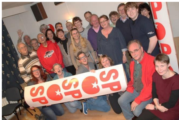
Foto van de oprichtingsbijeenkomst van de kerngroep

Om meer actieve leden te krijgen, meer te kunnen buurten en meer acties op touw te kunnen zetten was een plek nodig waarop alle actieve leden bij elkaar konden komen om afspraken te maken over momenten waarop de buurt in gegaan kon worden, om actualiteiten