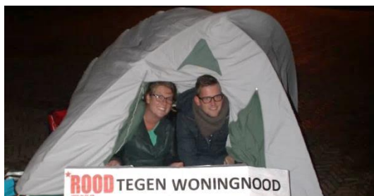
'Moeten we dan in tenten gaan wonen?' aldus ROOD tijdens een actie tegen woningnood voor het gemeentehuis

Het gaat hier om de actie "Bouw leegstaande panden om tot goedkope kamerwoningen", gevoerd in oktober/november. De jongeren van ROOD stonden met een tent, posters en