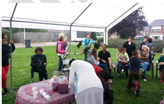
Bewoners Van Houtenstraat in actie voor speeltuintje met steun SP Kerngroep

kwamen zij in actie tegen het thuiszorgfiasco dat begin 2013 plaatsvond door een verkeerde aanbesteding. Daarover heeft de SP een zwartboek gemaakt, dat kerngroepleden en folderaars door heel Zutphen verspreid hebben. Zo wist heel Zutphen wat er ècht is gebeurd in de thuiszorg en kon niemand in de mooie praatjes van de wethouder trappen (hij beweerde dat er niets mis was in de thuiszorg in Zutphen). Aan het einde van het jaar hield de SP Werkgroep Lochem een succesvolle thema-avond over de thuiszorg in Lochem. Ook heeft de SP geknokt voor ondernemers, door een enquête af te nemen bij de vele winkeliers in de Zutphense binnenstad en winkelcentra in de gemeente. Daaruit kwam naar voren dat ondernemers in Zutphen geen behoefte hebben aan koopzondagen. Verder hebben leden van de kerngroep gestreden voor een recreatiefunctie in het nieuwe zwembad, een speeltuin in de Van Houtenstraat en verbetering van de riolering in de Tjerk Hiddesstraat, en hebben zij de bewoners van de Bieshorstlaan en de Scheurkamp in Warnsveld geholpen in hun strijd tegen gedwongen verhuizingen omdat hun woningen gesloopt worden.