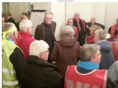
SP Kerngroep ondersteunt thuiszorgers in actie

te bespreken en acties te plannen. Daartoe is op 11 januari 2013 succesvol 'de kerngroep' opgericht. De kerngroep vormt, zoals het woord het al zegt, de kern van de SP. In de kerngroep zitten alle actieve SP-leden: bestuursleden, raadsleden, ROOD –jongeren, folderaars en alle andere mensen die op één of andere manier actief betrokken zijn bij de SP. De kerngroep kwam in 2013 om de 8 weken bij elkaar (inmiddels is die frequentie wegens succes verhoogd naar om de 5 weken). Vanuit de kerngroep werden diverse acties op touw gezet.